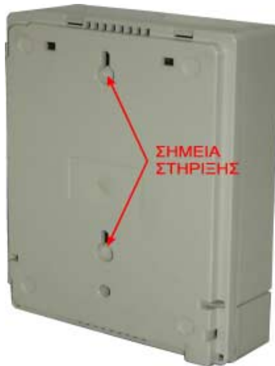
Εικόνα 1 Τα δυο σημεία της στήριξης του netMod στον τοίχο

Το netMod μπορεί να τοποθετηθεί επιτραπέζια ή στον τοίχο. Η στήριξη του netMod στον τοίχο γίνεται στα δυο σημεία στήριξης στο πίσω μέρος της συσκευής (η απόσταση μεταξύ των στηριγμάτων είναι 10cm), όπως αυτά φαίνονται στην επόμενη εικόνα.